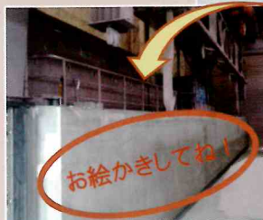
クレーンで運ぶ 予備ゲート