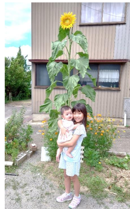
かわいいで賞(春日)