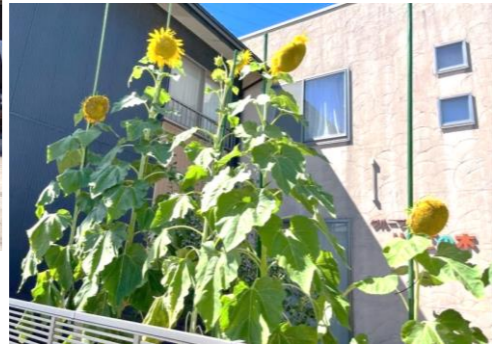
ただひたすらみんなを見つめているで賞 (りんごの木)