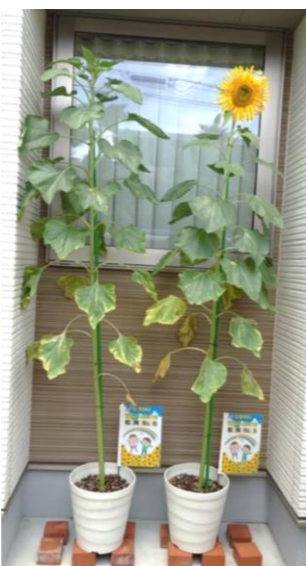
なかよしで賞(観音)