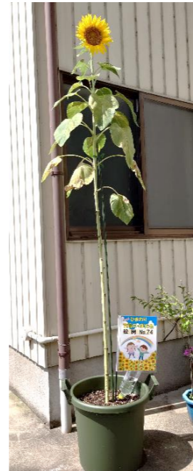
スマートで賞(薬師)