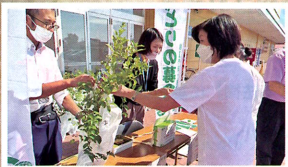
緑化苗木の配布（鯖江市）