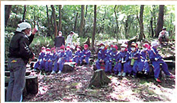
子どもたちの森林学習（若狭町）