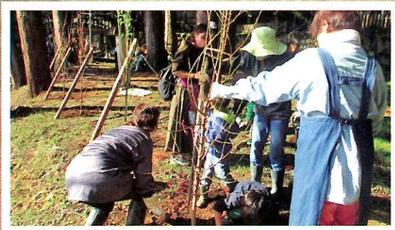
地域での植樹活動（越前市）