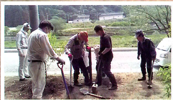
ボランティアによる森づくり活動（大野市）