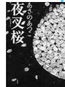
「夜叉桜」 あさのあつこ (光文社)