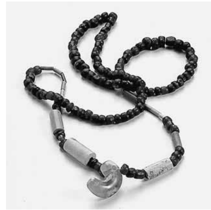
花野谷1号墳・玉類（福井市）