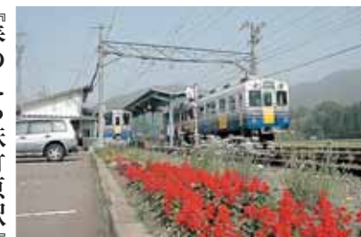
『春のえち鉄竹原駅』