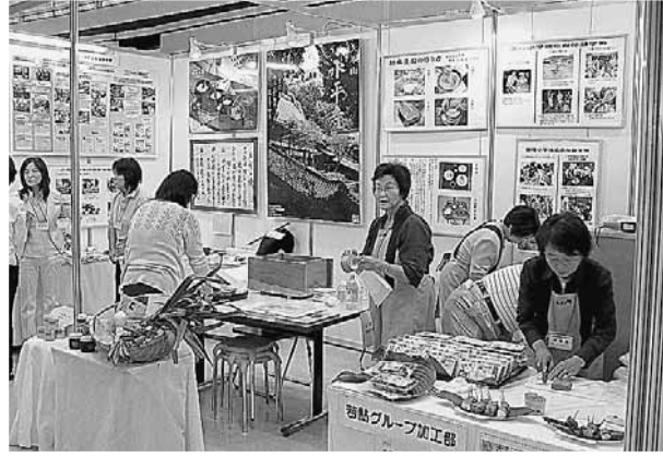
6月にサンドーム福井で開催した「食育推進全国大会」に出展