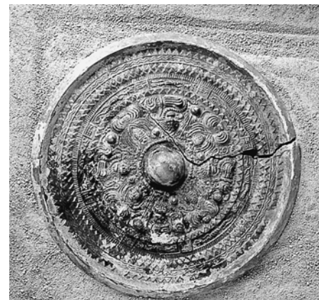
花野谷1号墳・鏡（福井市）

会 期：11月25日（日）まで（月曜休館） 会 場：永平寺緑の村四季の森文化館 開館時間：10時～17時（入場16時30分まで） 入 館 料：一般300円、小中学生150円 お問い合わせ：生涯学習課 ☎61-2009