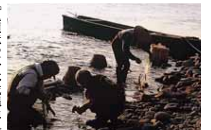
『九頭竜の恵み、威縄漁』