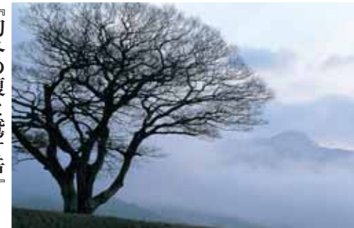
『初冬の榎と鷲ヶ岳』