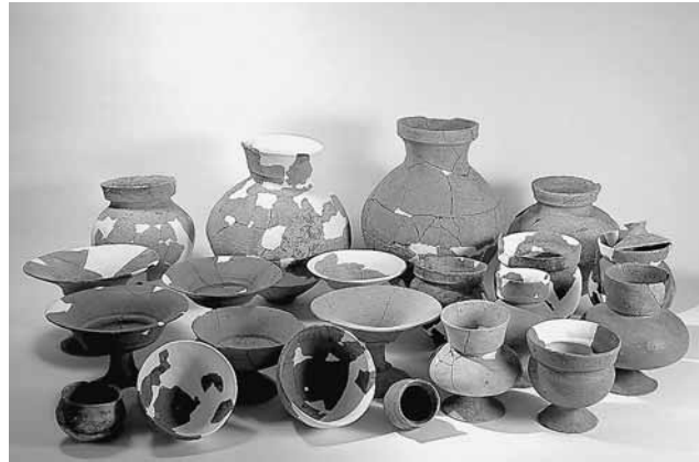
東古市縄手遺跡・土器（永平寺町）