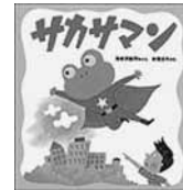
「サカサマン」 海老沢航平 (くもん出版)