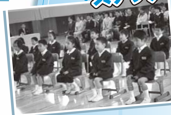
緊張の入学式。 「うちの子は大丈夫かしら？」 後方でお母さんがたも心配そうです。 4月6日 上志比小学校入学式にて