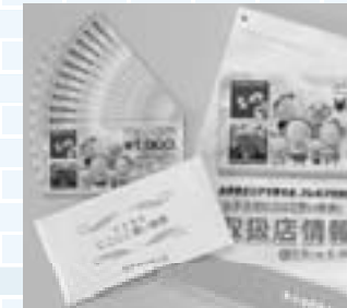
「にここにお買い物券」と発売時に配られた「取扱店情報カタログ」

発売数は総額1億円(1億1千万円分)。1,000円のお買い物券11枚セットを1万円で販売。家族1人につき3万円まで引き換え可能です。千円分のプレミアム分は町と町商工会が負担しています。町商工会では、「販売状況を見ると完売は間違いない」とのこと。発売・使用とも6月末まで。まだの人はお早めに！