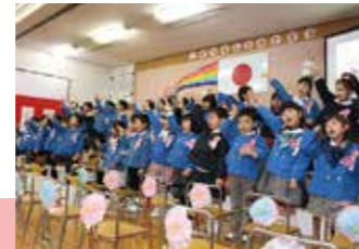
手話を交えてお別れの歌を歌う卒園児たち(志比幼稚園)