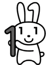
愛称：マイナちゃん

※法律で定められた目的以外でマイナンバーを利用したり、他人に提供したりすることはできません。