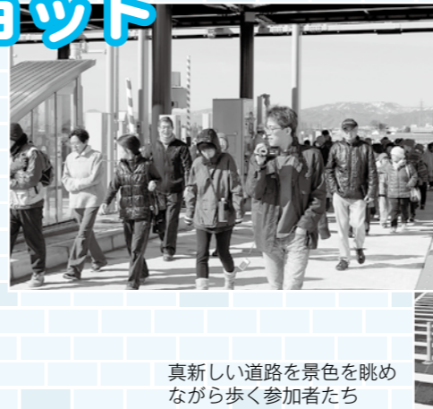
真新しい道路を景色を眺めながら歩く参加者たち