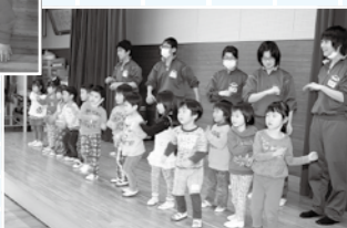
園児たちと一緒にダンスを踊る中学生たち