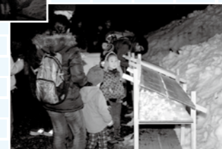
希望の灯火に願いを込める参拝客