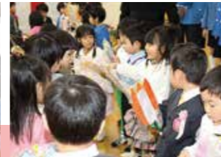
在園児からプレゼントをもらう卒園児たち(志比幼稚園)