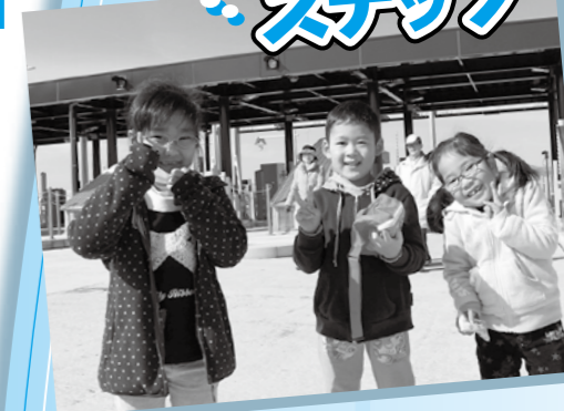
「開通前の新しい道を歩くのは気持ちいいな!!(^◇^)」 (2月21日 中部縦貫自動車道 (福井北JCT・IC～松岡IC) 現場見学会より)