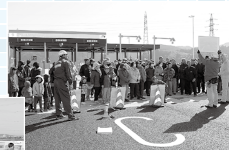
福井北JCTにて説明を聞く参加者たち