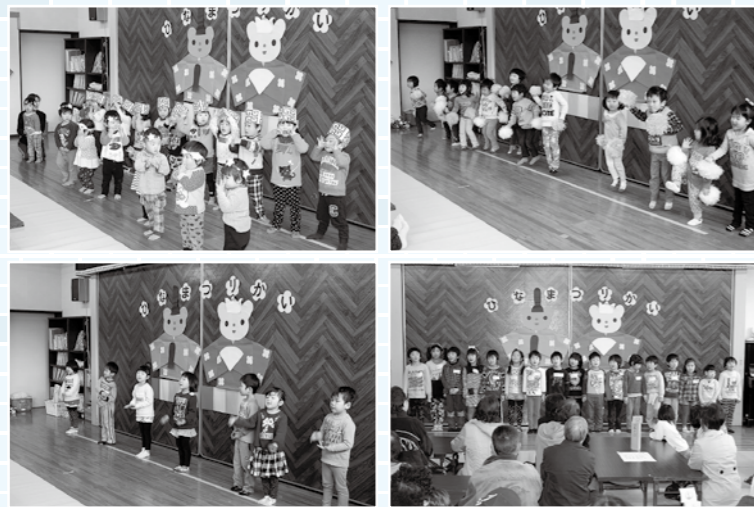
各クラスの発表の様子