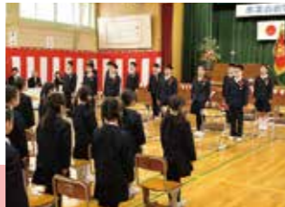
在校生に感謝と別れの言葉をかける卒業生たち(吉野小)