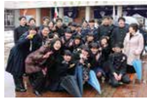
恩師・後輩と一緒に写真撮影