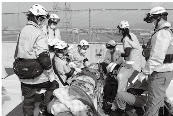
負傷者の応急処置をする 福井大学医学部の医師と看護師

学部附属病院、県警本部交通部高速道路交通警察隊、国土交通省近畿地方整備局 福井河川国道事務所などの9機関計60名が参加し、相互の密接な連携と協力体制の強化を図りました。