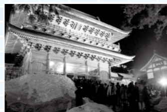
幻想的にライトアップされる山門

今後も、各世代に合ったさまざまな情報をどんどん発信していきますので、皆さまもパソコンやスマートフォンからアクセスして、町の旬な情報に触れてください。また、職員一同、皆さまの「いいね！」をお待ちしております!!