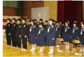
涙をグッとこらえ「証」を歌う卒業生