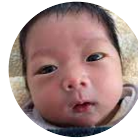
とえだ ばんりくん