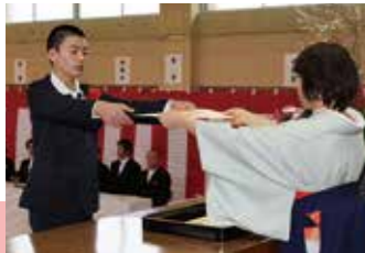
卒業証書を大事に受け取る児童(吉野小)