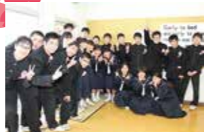
卒業式前に卒業生全員で集合写真

上志比中学校では、22人の卒業生が同校伝統の「礼の心」や一緒に歩んできた仲間・恩師・後輩との3年間を振り返りながらの式となり、校門前でのお見送りでは、卒業生が別れを惜しみ、恩師や後輩と固く握手、抱擁する姿が見られました。