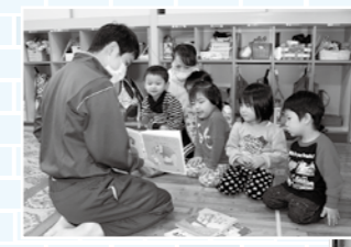
園児たちに絵本を読む中学生

また、28日には、「万灯会」が行われ、参拝客らが備えた「願い燈籠」やろうそくの「希望の灯火」を前に、先祖供養や震災復興を祈願し、役寮や雲衲衆らが法要を営みました。