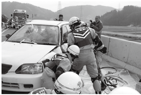
負傷者を救出するため、事故車両を破壊する消防隊員

3月1日の開通を控えた中部縦貫自動車道 福井北JCT～松岡ICにて、多重衝突事故が発生、5台の車が道路を塞ぎ、多数の負傷者が事故車内にいるという想定で総合防災訓練が行われました。