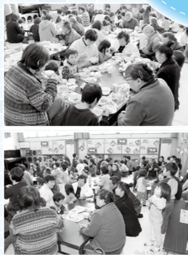
おじいちゃん・おばあちゃんたちとゲームやお昼ご飯を食べる園児たち