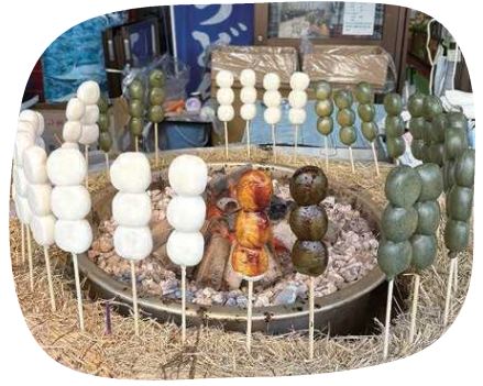
並べられているご利益団子