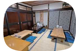
ゆったり過ごせる和室の店内