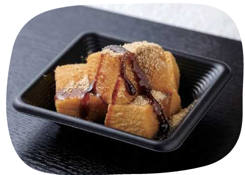
スイーツ生ごま豆腐