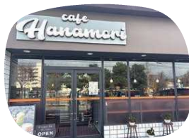
日常に寄り添うカフェ