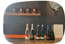
テイスティング可