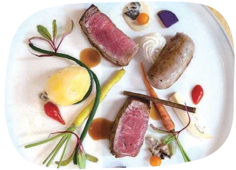
特選牛ヒレステーキと自家製フランクのグリル

四季ごとにメニューを一新したり、テーブルでの演出にも工夫を凝らしたりとお客様に通っていただく工夫をしています。ランチのサラダビュッフェや季節のコースなど満足度の高い食事が楽しめる、魅力が詰まったお店です!