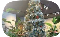
期間限定のクリスマスツリー