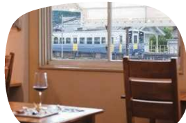
窓から見えるえちぜん鉄道