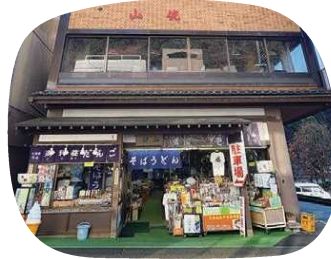
つい入りたくなる外観

永平寺参道にある「山供」は、戦後から続く観光客に人気のお店です。名物の「ご利益団子」は、注文すると串を切って渡され、長い串を切ることが「苦(く)死(し)」を断つことに繋がると言う意味が込められています。また、店内では蕎麦などの食事を取ることもでき、念珠やお土産の種類も豊富に揃っているので、永平寺参拝の際には是非立ち寄ってみて下さい!