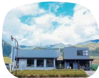
大自然の中で楽しむカフェ