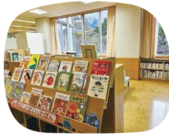
窓が多く全体が明るい図書館

永平寺町石上29-67-1 営/ホール他 9:00~22:00 図書館 10:00~18:00 休館日/毎週月曜日、毎月月末、年末年始 TEL.0776-64-3170 上志比ICから車で約3分 【えちぜん鉄道】越前竹原駅から徒歩約16分