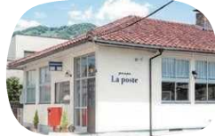
当時の面影が残るレトロなたたずまい