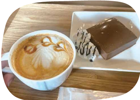
日替わりのラテアートとチョコババロア