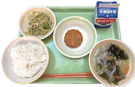
地元食材を使った給食