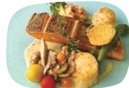
サーモンと 北海道帆立貝のポアレ