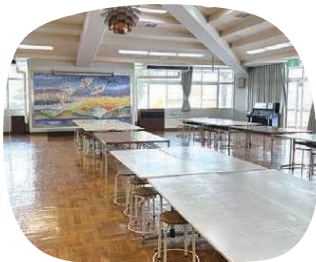
全校生徒がこのランチルームに 集合