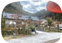
永平寺参道が見渡せる テラス席からの景色