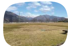
全面が芝に覆われ、四季も感じるができます