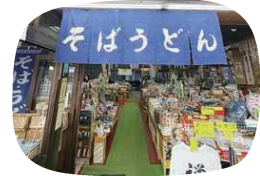
色々な種類のお土産が置いてある店内

福井名物や福井のお土産がたくさんあります!ご利益団子が食べられるのはこの店だけなので是非是非寄ってみて下さい。