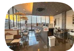
落ち着いた雰囲気の内装

永平寺町は、静かな自然と人の温かさを支えられ、禪の文化と歴史が暮らしの中に息づく町。毎日の生活を、ゆっくり大切にできる永平寺町です。この町で育まれてきた味と伝統を、永平寺町の風土とともに、日々まっすぐ守り続けています。素材と手間を惜しまず、胡麻豆腐づくりと向き合っています。