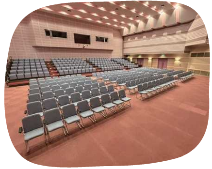
大ホールは音響、照明も完備