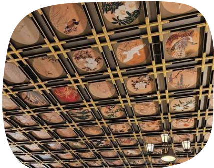
花鳥以外の動物を見つけられるかな?

太陽のSUNと燦々の燦をかけた名前がついている通り、日当たりの良い建物となっています!2階には図書館もあるので、勉強や調べ物にぜひご利用ください!