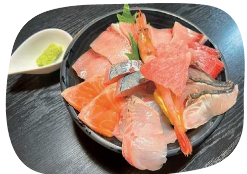
新鮮な海の幸がぎっしりの「うらの海鮮丼」