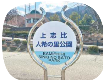
世代を問わず利用できる公園

永平寺町石上31-87 上志比ICから車で約3分 【えちぜん鉄道】越前竹原駅から徒歩約16分