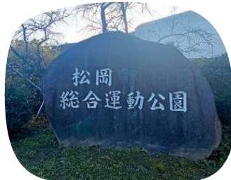
松岡総合運動公園の石碑

永平寺町松岡湯谷33-1-1 営/火曜~日曜の8:30~21:30 休館日/祝祭日を除く毎週月曜日と年末年始 ※月曜日が祝日の場合、次の日が休館 松岡ICから車で約3分 【えちぜん鉄道】松岡駅から徒歩約55分