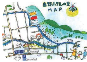
見どころが一目で分かる 吉野ホタルの里MAP

永平寺町松岡吉野25-18 (松岡多目的集会センターさおづ荘) 開館時間/月～金(水曜日休館日) 松岡ICから車で約2分 【えちぜん鉄道】松岡駅から徒歩約40分