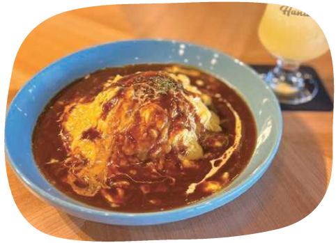
当店限定オムライス