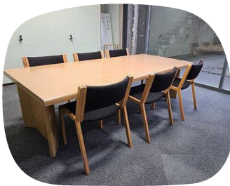
会議室は少人数での利用にオススメ