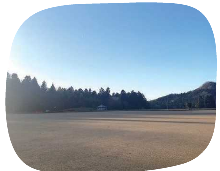
自然に囲まれたグラウンド