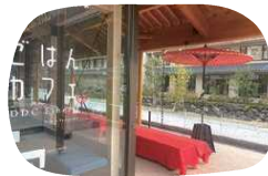
ペットと一緒に楽しめるテラス席