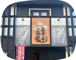
落ち着きのある外装