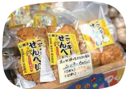
地元の恵みが詰まった ニンニク醤油味のニンキーせんべい