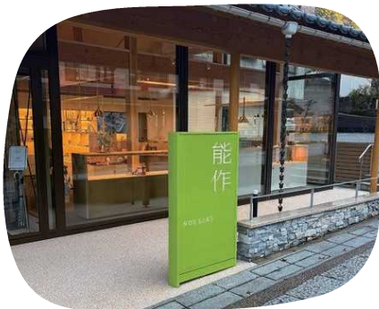
自然を感じられる外観

磐座の隙間を覗くともしかしたら白蛇をお目にかかれるかもしれません! 雨の降る日の前日が狙い目です。