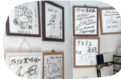
多くの有名人のサイン