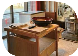
店主のそば打ち台