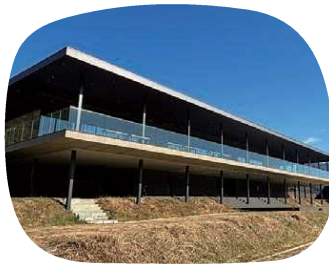
スタイリッシュな外観

永平寺町下浄法寺第12-17 営/10:00~17:00 休/水曜 永平寺参道ICから車で約13分 【えちぜん鉄道】永平寺口駅から徒歩約40分