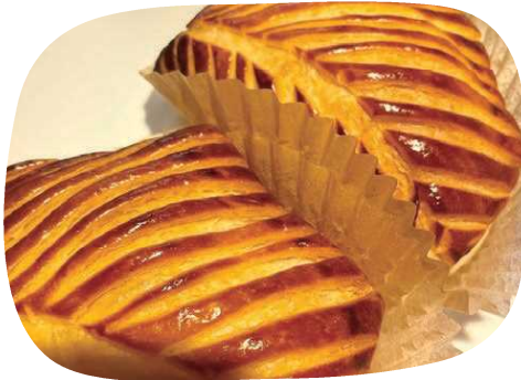
幻のアップルパイ