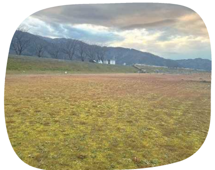
広くて風通しがいい