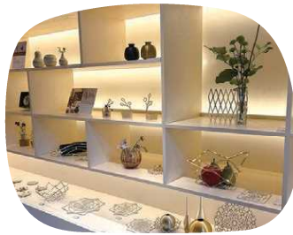
おしゃれな工芸品をいかがですか