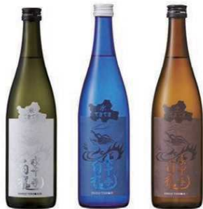
てきてぎシリーズ

五合そば・十合そばは、「おろしそば」と「けんぞうそば」両方の味を一度に楽しめる、満足感たっぷりの人気メニューです。