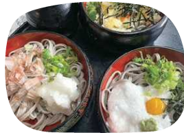
一休の美味しいお蕎麦