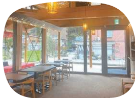
落ちついた雰囲気店内