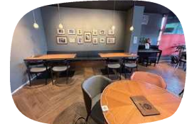
ゆったりくつろぐ店内