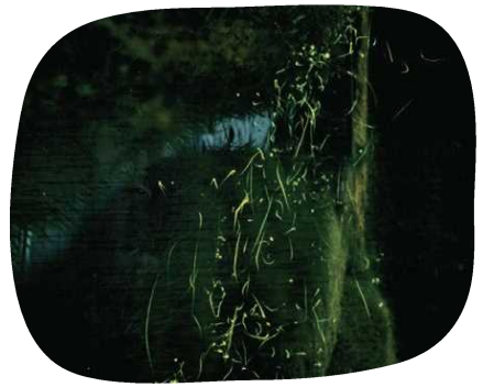
ホタルが創り出す天の川