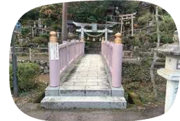
御神体につながる橋