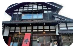
昔ながらの日本家屋を生かした 趣のある佇まい