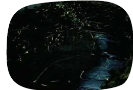
吉野を飛び交うホタル

運が良ければ、川面が螢で天の川のように輝き、山際はクリスマスツリーのようにきらめく特別な夜に出会えます。繁殖など人工的な干渉を行わず、自然本来の輝きを大切にしている点も魅力です。