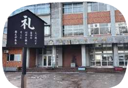
「礼の心」を養う校門