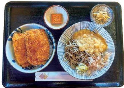
ミニソースカツ丼と二八ろろしそばセット (取材当時、越前蕎麦とGODIVAのコラボキャンペーン中)

こだわり抜かれた建築デザインのなかで、お酒だけではなく空間そのものを味わうことができます。