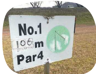
マレットゴルフの看板

スポーツ、レクリエーション等を通じ、自然と親しむ機会の提供を行っています。主に町民スポーツ祭のマレットゴルフ会場となっており、多くのコースが設置されています。また、春には桜が咲いたり、天気の良い日には綺麗な星空を眺めたりすることができます。近くにはフリースタイルカヤックができる「ナミノバ」もあり年に1回大会も開催されています。ぜひ、スポーツや景色を楽しんでください!