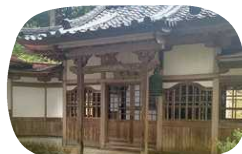
観音堂。中にも入れます