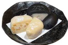
ピクニックコーン大福と 大人の吟醸酒饅頭