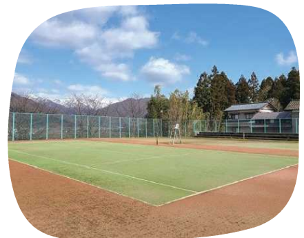
家族全員でテニスが楽しめます