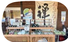
店先には新鮮な野菜が並び