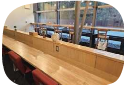
テレワークスペースは日当たりばっちり