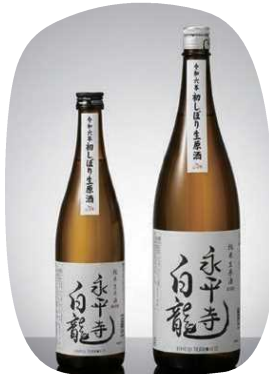
純米初しぼり生原酒