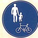
普通自転車歩道通行可

「普通自転車歩道通行可」の標識がある場合などは、普通自転車は歩道を通行することができます。