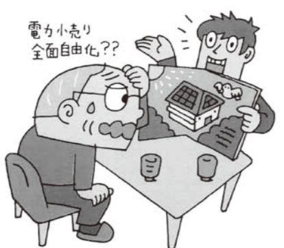
電力小売り 全面自由化??

2016年4月に電力料金が自由化になる。その前に太陽光発電システムを設置し、電気を売買すれば儲かる」と電話があり、自宅で業者の説明を聞いた。設置料金は200万円ほどで、ローン