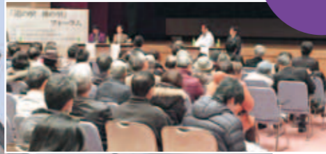
道の駅 禅の里フォーラム