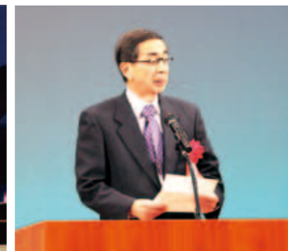
来賓祝辞(西川県知事)