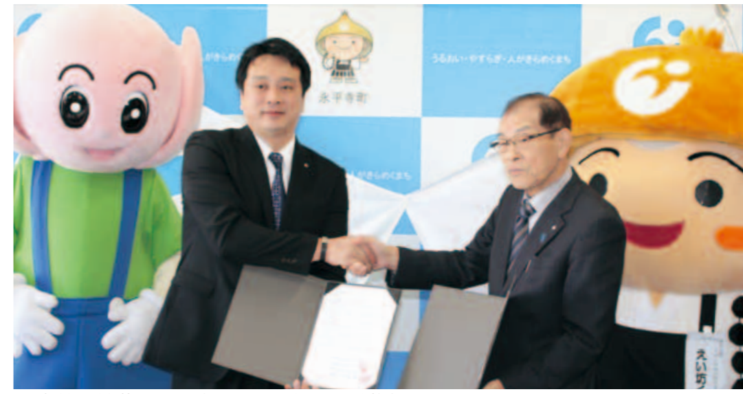
災害時相互応援協定を調印し握手する 永平寺町長 と 南越前町長 南越前町の「はす坊」と 永平寺町の「えい坊くん」も同席 場所：永平寺町立図書館

南越前町と協定 災害時に相互救援活動を 2月18日、永平寺町立図書館で、永平寺町は南越前町と『災害時相互応援協定』を締結しました。この協定は、気象災害や地震など大規模災害が発生したとき、資機材や物資に関する物的支援、行政機能を継続するための行政支援、ボランティアの募集及び派遣に関する人的支援、児童・生徒の受け入れの避難支援など、実効ある救援活動を相互に行うことを目的とするものです。 また、南越前町とは、平成27年1月30日に『原子力災害時における南越前町民の広域避難に関する協定』を締結しています。