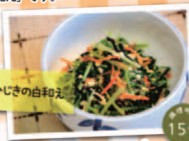
みずなとひじきの白和え

食生活改善推進委員会では、 地区での料理教室を開催して おります。 お気軽にお問い合わせください。 (松岡保健センター TEL.61-0111)