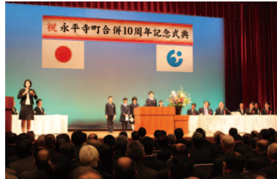
町と同じ10歳になる小学4年生7名による『永平寺町への想い』の発表