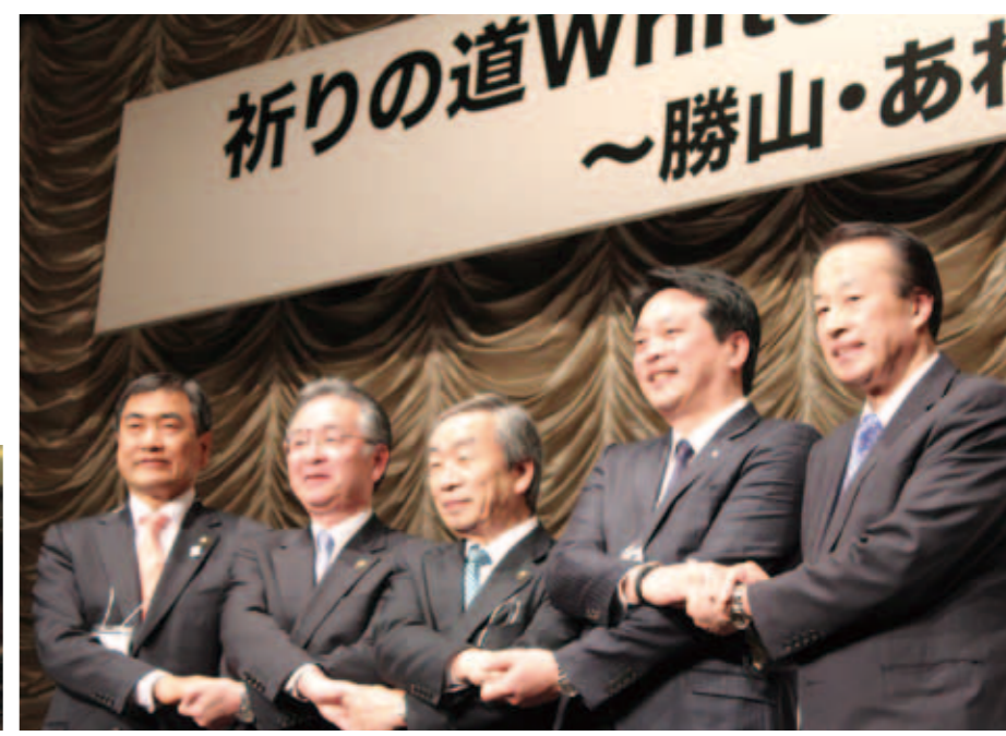
大盛況の会場 固く握手を交わす 勝山市長・あわら市長・坂井市長・永平寺町長・加賀市長

美(つま)し国越前加賀美食フェアが2月8日、ホテルニューオータニ(東京都)で開催され、本町をはじめ関係5市町が、名勝や各地域の地元の食文化をアピールしました。