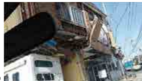
熊本地震(車内から撮影)

「コミュニケーションかもし れません。小さな備えが、 大きな助けになるのです。 今すぐできる「災害への備 え」をまとめました。大災 害が起きてから、後悔しな いように。今すぐ、左記の 4つの備えを始めましょ う。