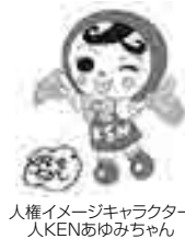
人権イメージキャラクター 人KENあゆみちゃん