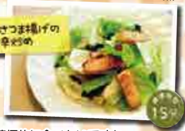
キャベツとさつま揚げのピリ辛炒め