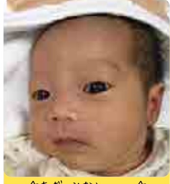
☆ただ みなと ちゃん☆