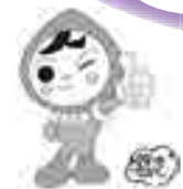
人権イメージキャラクター 人KENまもる君