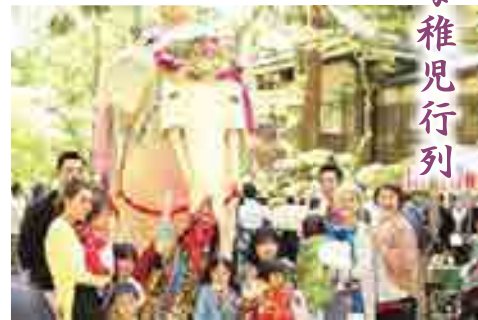
白象と一緒に家族で記念撮影

稚児と父母ら約500人の行列が高さ約3.5メートル、体長5メートルの模造の白い象を引いて練り歩き、子どもたちの健やかな成長を願いました。