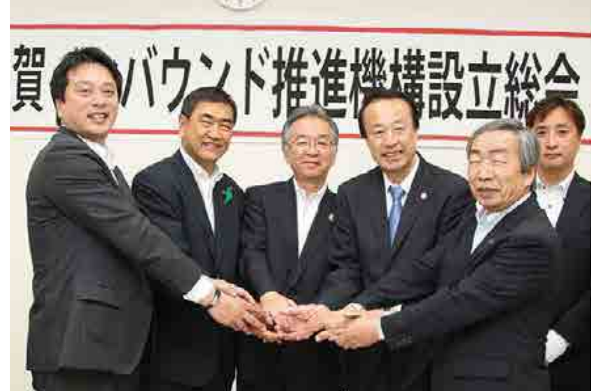
笑顔で握手を交わす 永平寺町長・勝山市長・あわら市長・加賀市長・坂井市長

「インバウンド」海外から日本へやって来る観光客・旅行、外国人を自国へ誘致すること。近年の訪日外国人の増加で頻繁に使われるようになった。