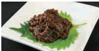
永平寺はまなみそ