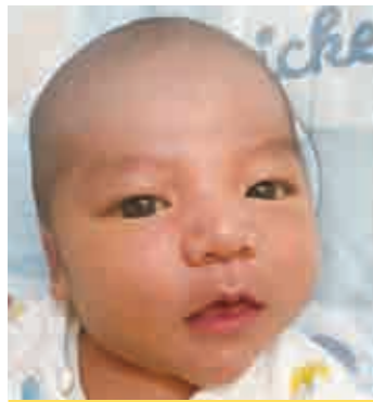
☆さかもと リトちゃん☆