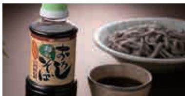
越前おろしそば専用つゆ