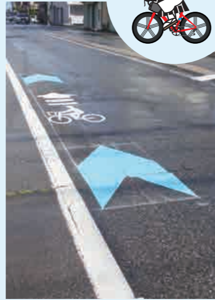
自転車通行用路面標示(役場本庁横)