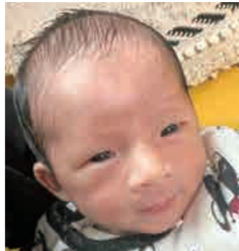
☆きたじま リトちゃん☆