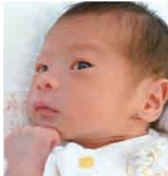
☆いちおか あおいちゃん☆