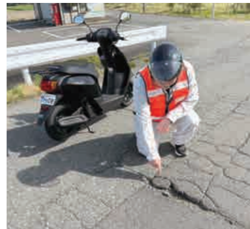
町内全域の町道をくまなく点検

4月9日、町内全域の町道点検パトロールを実施し、12名の職員が2人1組の6班体制で、原付バイクや公用車で町全域の町道をくまなく点検しました。このパトロールは、道路の舗装状況が悪い所や、通学路、危険ブロック塀、屋外広告物などを重点的に点検することで、事故の未然防止や被害の軽減につなげるために実施しています。