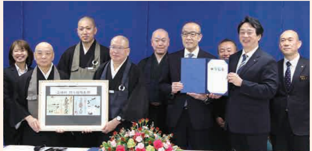
〔北陸禅の里づくり交流促進協議会〕の設立合意書など示す、大本山総持寺祖院、大本山永平寺、輪島市、永平寺町

地域の相互交流、共同事業の展開による地域活性化、能登半島地震の復興を目的に、石川県輪島市、大本山永平寺、大本山総持寺祖院(石川県輪島市)、永平寺町が「北陸禅の里づくり交流促進協議会」を設立しました。輪島市と永平寺町は以前から職員の交流などを行ってきました。令和6年の能登半島地震の際には、被災地へ支援物資を届けたり、商工会青年部が輪島市門前町の「門前雪割草まつり」に参加したりなど、地域の交流を深めてきました。