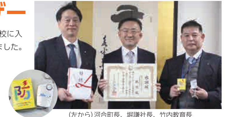
(左から)河合町長、堀謙社長、竹内教育長

ブザーは危険を誰かに知らせるためのものであって、子どもたちを守ってくれるわけではありません。子どもたちを犯罪から守るため、音が聞こえたら駆けつけるなど、大人のみなさんご協力をお願いします。